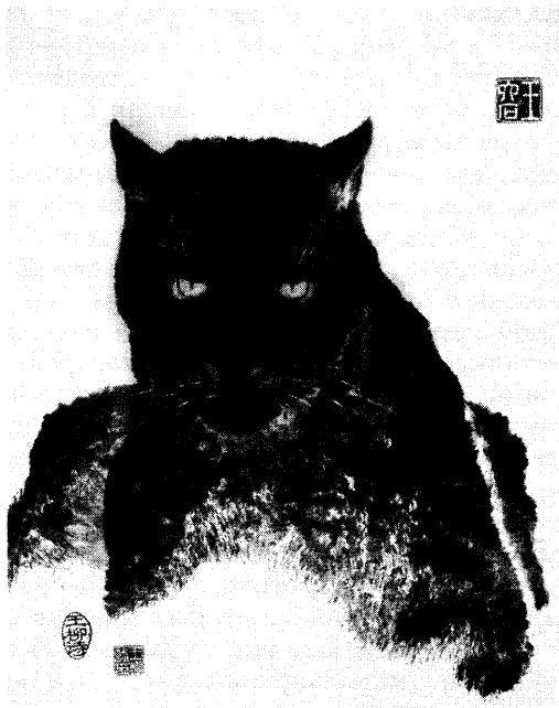
Черная пантера (Бумага, тушь)

Дерзость моя была безгранична — я купила кисти, краски, тушь, бумагу в их случайном сочетании и ... начала, даже не представляя как правильно пользоваться этими незнакомыми мне предметами. Я и не могла предположить, что даже сами китайцы пишут годами иероглифы перед тем, как “чиркнуть” что-то, напоминающее образ-картину. Не знала я и того, что главное в классической китайской живописи — точная линия в полном объеме ее выражения: мокрая-сухая, короткая-длинная, темная-светлая, прямая-изогнутая. И что только контрастное и ритмичное выражение таких линий делает написанное цельным и ритмичным. Постепенно я стала понимать природу линий, туши и красок, символику. Реалистичная китайская живопись уже больше не казалась мне только красивым и элегантным исполнением предметов, а превращалась в изображение как бы формулы этого предмета с внутренним динамизмом. Загадок становилось все больше и больше. Трехмерное пространство и перспектива, к чему привыкло мое европейское восприятие, разбивались вдребезги об изломы линий на картинах китайских ландшафтов. Вот тут я совсем запуталась. Очень долго я старалась понять, почему и как у китайцев сложилось такое своеобразное понимание перспективы. Здесь я могу только склонить голову перед великой культурой, сочетающей в реалистичном выражении простых предметов глубочайшую