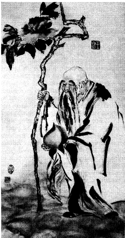
Мудрость (Бумага, тушь, краски)

Однако в первый же день после официального снятия запрета на въезд в Китай господин Тан написал письмо художнице с предложением еще раз обратиться в администрацию музея с просьбой возобновить переговоры о выставке. Бесконечные изменения в графике проведения выставок в музее из-за болезни вдруг выстраиваются самым счастливым для нее образом. Тан Хуэймин написал, что каким-то магическим образом “ее” зал (точнее, четыре зала)